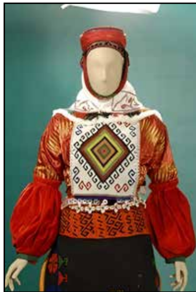
Resim 10: Tor, Kolçak (Ege Üniversitesi Etnoğrafya Müzesi, 2019).