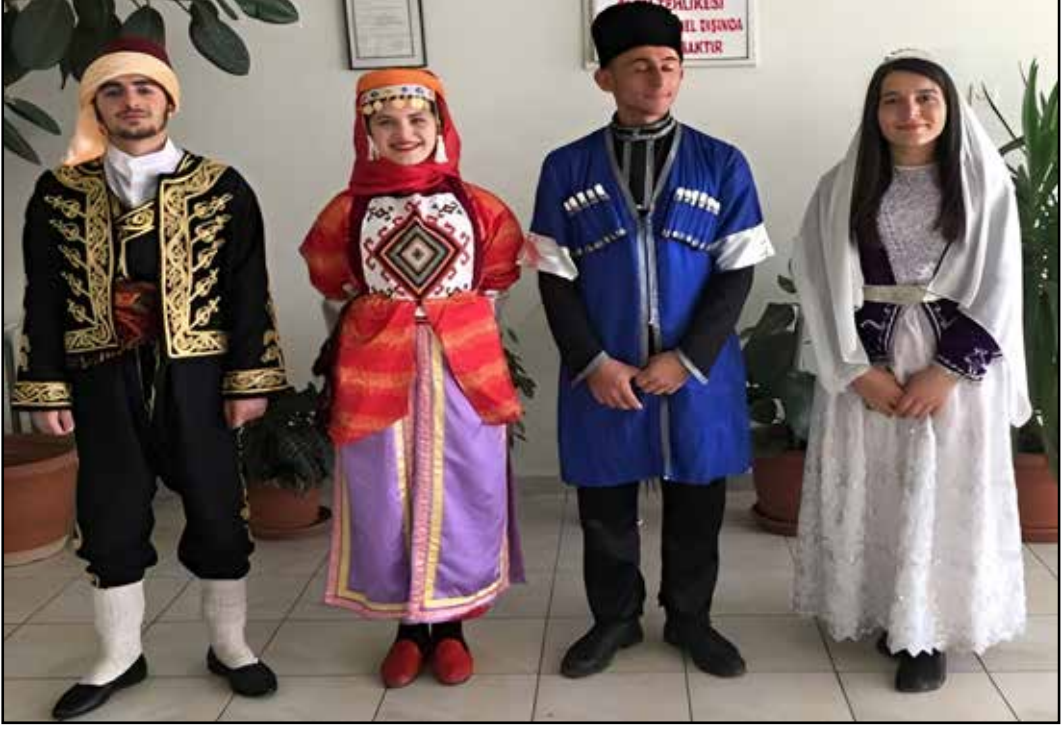
Resim 1: Türkmen (Sol Çift) ve Kafkas Giysileri (Sağ Çift) (Öztürkhan, 2019).