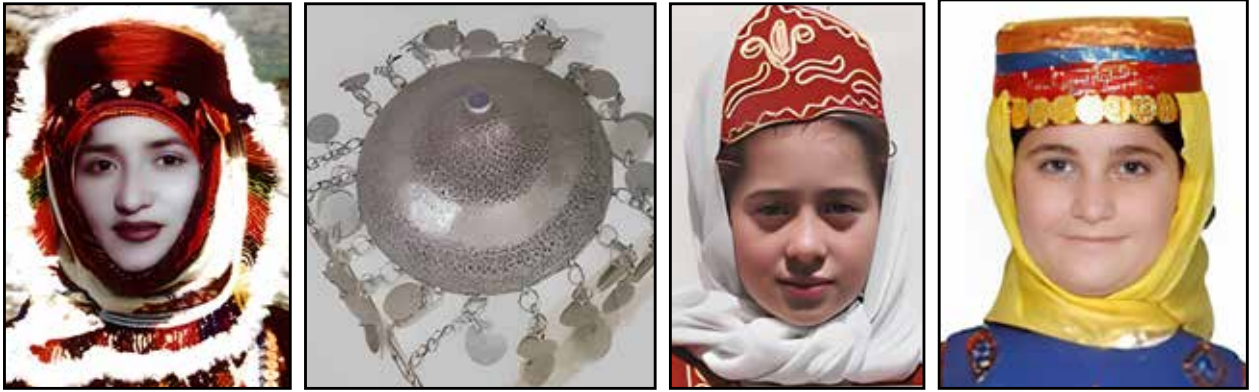
a. Türkmen başlığı