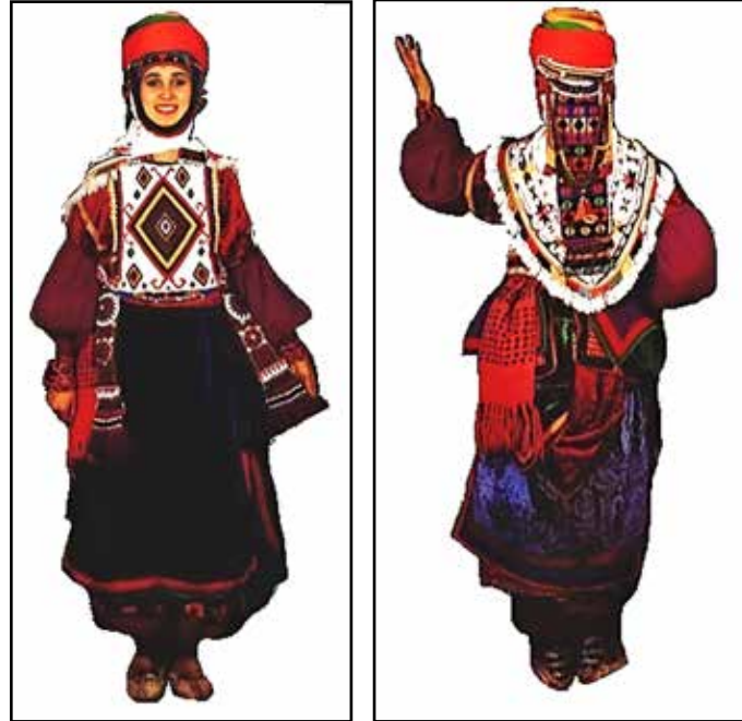
Resim 2: Kars, Türkmen Evli Kadın Kıyafeti (Orta Doğu Video İşletmeleri A.Ş.,1986, s. 97-98).