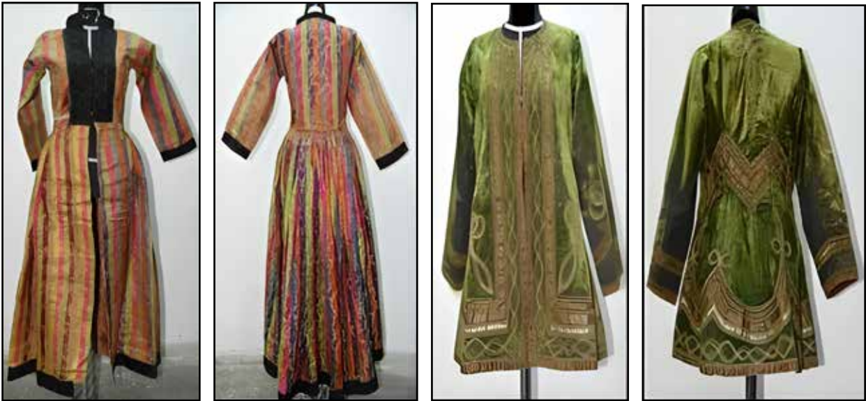
Resim 4: 18. yy Osmanlı Entari (Üst Çift) ve Kaftan (Alt Çift) (Kars Müzesi, 2018).