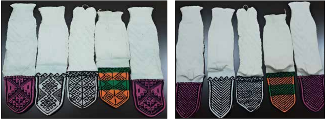
Resim 9: Yün Çorap, Önden (Üst) ve Arkadan (Alt) Görünümü (Mert, 2019).

(Kars İl Kültür ve Turizm Müdürlüğü, 2019).