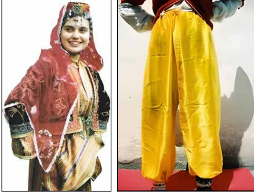
Resim 5: Göynek ve Cepken giyimli kadın (Çiftçi, 2015: s.131).