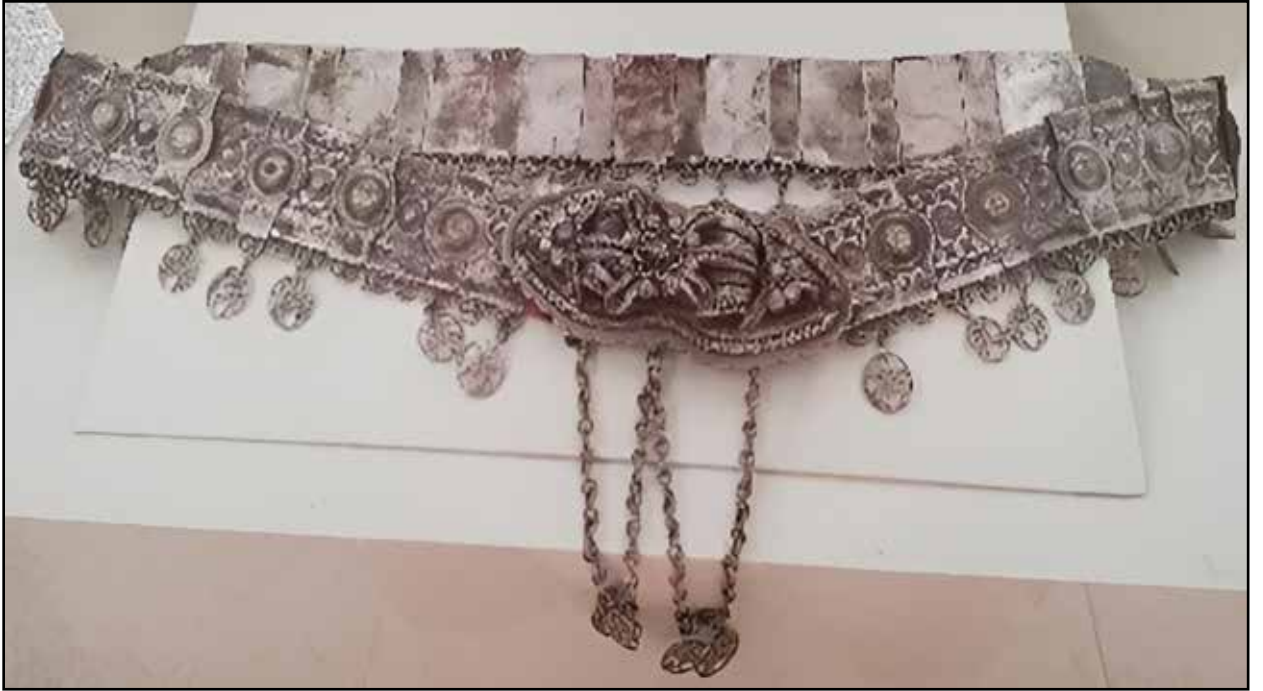
c. Gümüş Kemer

Resim 11: Kemer ve Kuşak Örnekleri, a. Kolan Kemer (KK2, 2019); b. Kurşak (Kars İl Kültür ve Turizm Müdürlüğü, 2019); c. Gümüş Kemer (Kars Müzesi, 2018)