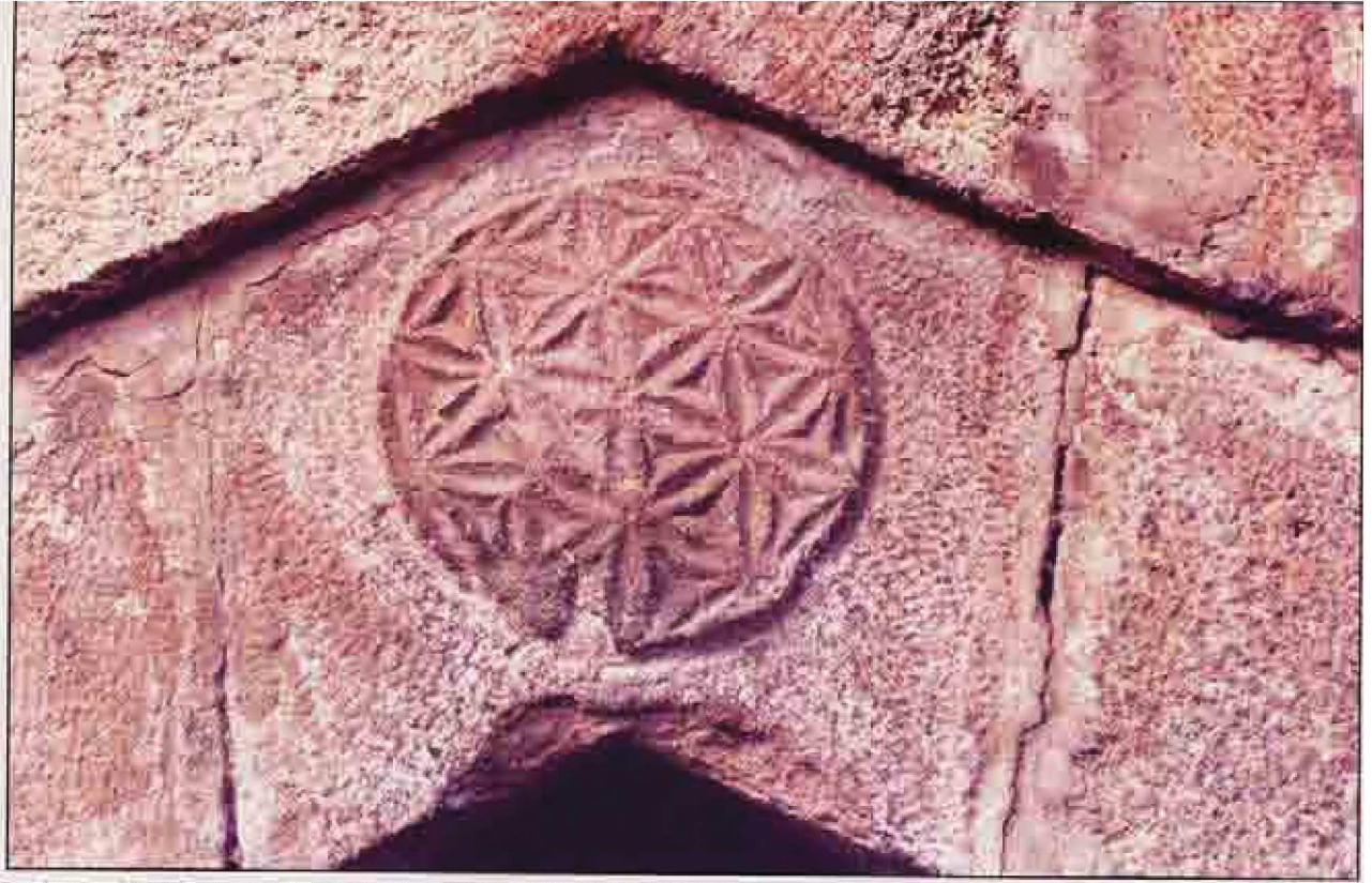
Resim 6: Sivri kemerin kilit taşında bulunan stilize çiçek motifi

tadır. Bani üzerine yapılacak araştırmalarla konunun aydınlığa kavuşacağı görüşündeyiz.