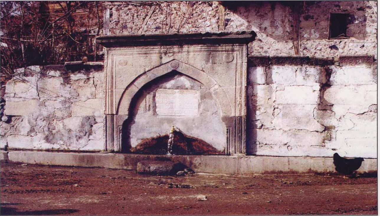
Resim 4: Çeşmenin cepheden görünümü