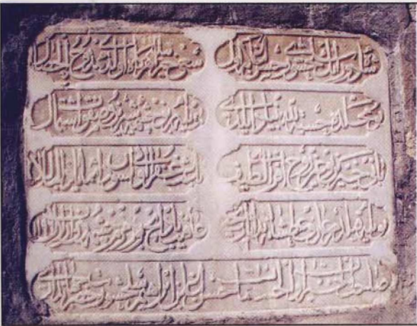
Resim 5: Çeşmenin kitabesi

"zemzem çeşmesi" tabirinin kullanıldığını öğrenmekteyiz.