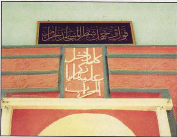
Resim 2: Çeltikçi eski caminin mihrabının üst tarafındaki yazı bölümü

mimarisinde çok sık rastlanan bir tarz olup; doğu ve batıdaki altlı ve üstlü yuvarlak kemerli kenar bordürleri taş silmeli pencereler dikkati çekmektedir. Üst örtüde düz ahşap tavan dıştan beşik çatı ile kapatılmıştır. İçte sonradan yağlı boya ile üzerinden geçilmiş yuvarlak nişli kavsarası bulunan alçı mihrabın üst orta aksında yazı görülmektedir. İçten dışa doğru üç silme hâlinde bezemeleriyle