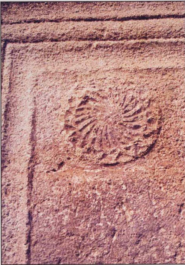
Resim 7: Çeşmenin kemer köşeliklerindeki çarkıfelek

sarnıçlar, havuzlar, çeşmeler, su kemerleri, su tünelleri bu mimari çözümlerinin bir yansıması olarak değerlendirilmelidir 7 .