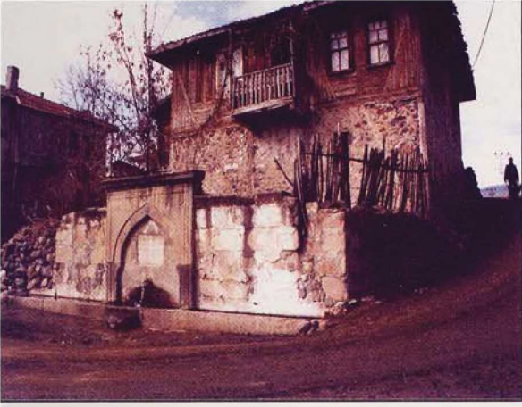
Resim 3: Osmanlı Dönemine ait çeşmenin kuzeydoğudan görünümü