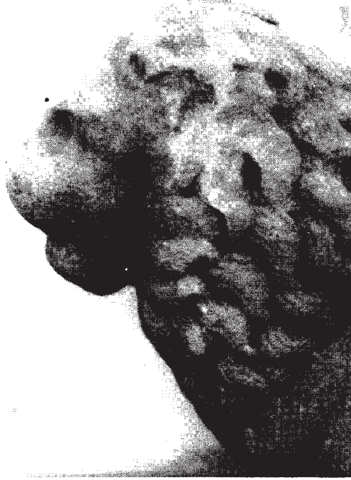
Resim: 7- Bař ve yeleye ait detay