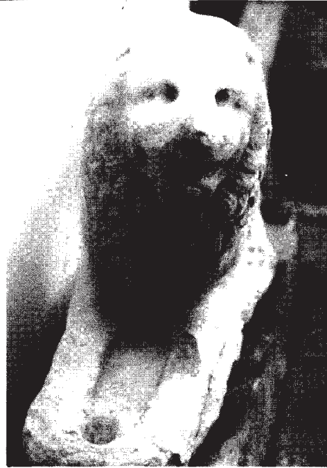
Resim: 8- Yele ve bacakların önden görünümü