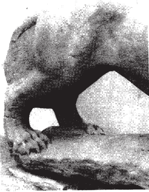
Resim: 5- Sağı ve arka pençeye ait detay