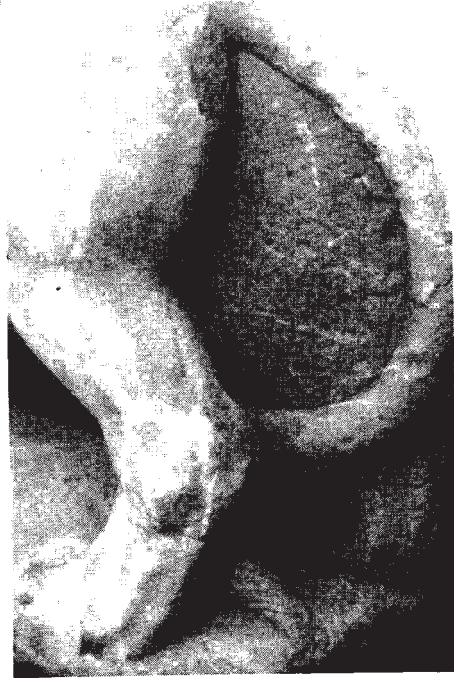
Resim: 6- Kuyruk ve arka pençelerin bir başka görünümü