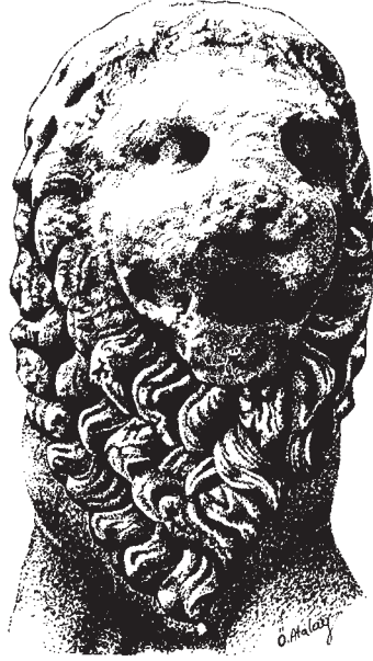
Resim: 4- Yele ve bacakların önden görünümü