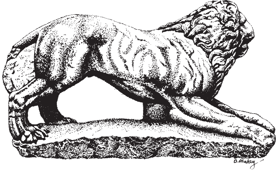
Resim: 3- Bař ve yeleye ait detay