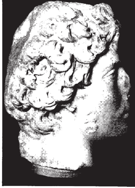
Resim: 1- Marcus Aurelius'un gençlik portresi