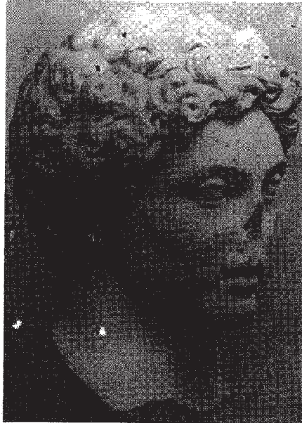
Resim: 3- Roma Museo Del Foro Romano