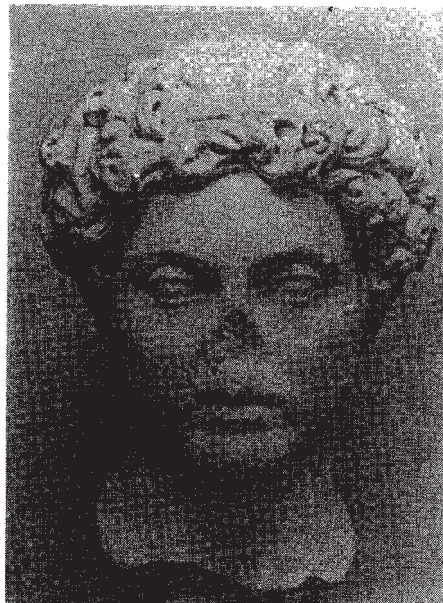
Resim: 4- Roma Museo Del Foro Romano