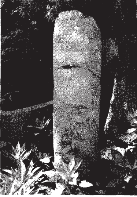
Resim: 1a- Küçük mil taşı