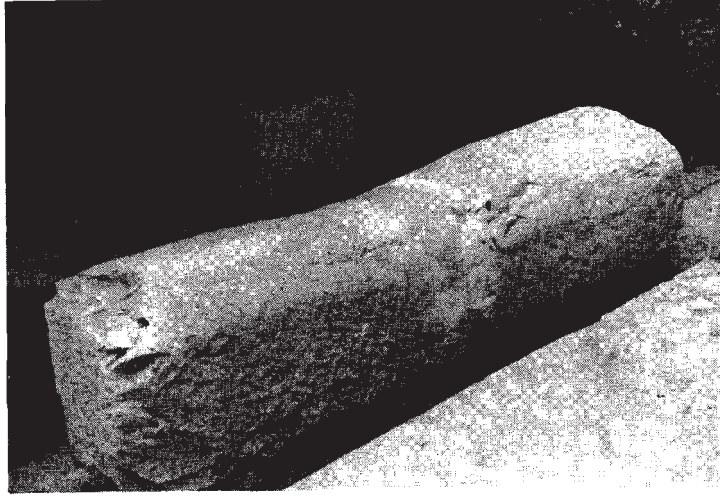
Resim: 2a- Büyük mil taşı