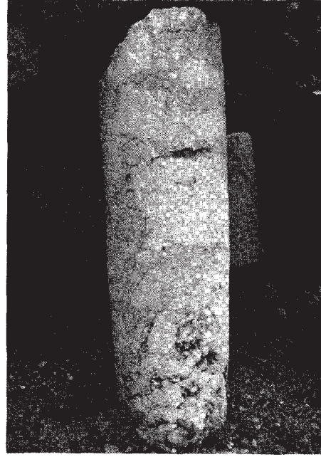
Resim: 1b- Küçük mil taşı